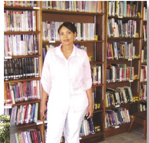
△ Philancia Braaft van Merweville Openbare Biblioteek.