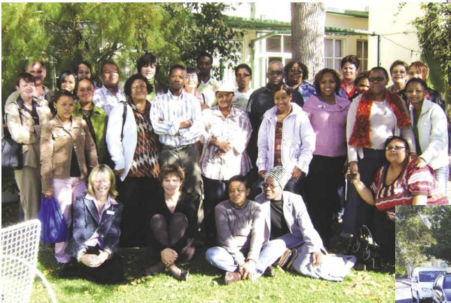
△ Beaufort-Wesstreek se personeel tydens die kursus.