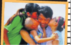
BELONING: Kinders moet gehoor en gesien word.

"Die verskil was dat sy – hoe goed ook al bedoel – altyd 'n oplossing voorgestel of hom gekritiseer het