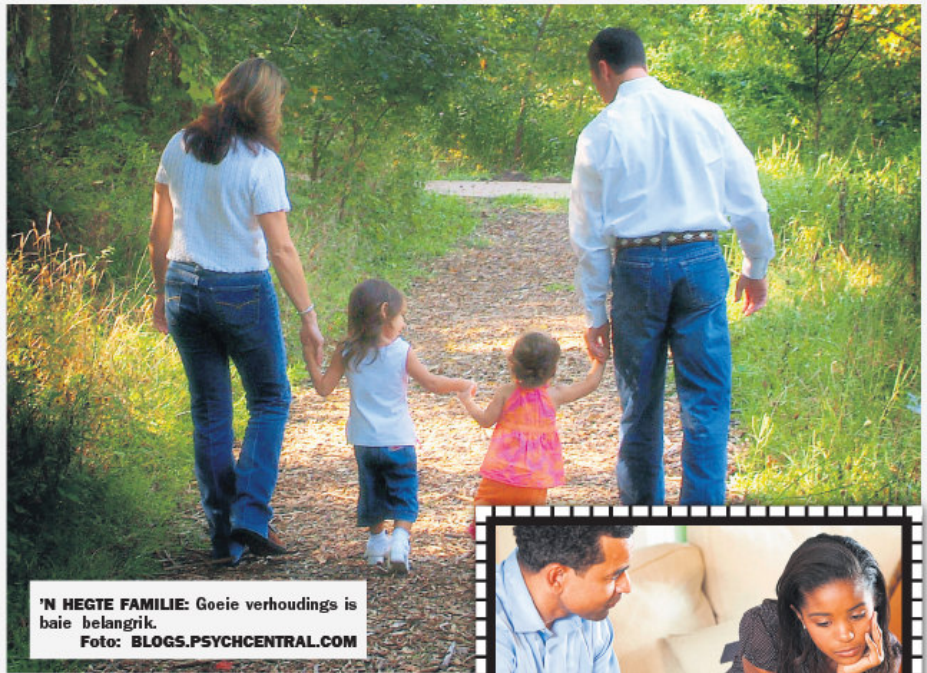
'N HEGTE FAMILIE: Goeie verhoudings is baie belangrik.

SMS JOU MENING OOR DIE STORIE AAN 31446 SÊ ONS! SMS: KOSKI 50