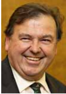
Donald Grant, Minister van Onderwys, Wes-Kaap

Die Wes-Kaapse Regering sal die lewensgeleenthede van al sy kinders verbeter deur aan hulle gehalte-opvoeding te voorsien. Vir hierdie doel sal alle kinders vir so lank as moontlik in die skool bly, en optimale uitslae behaal. In die tydperk 2010 tot 2019 sal die fokus veral op die verbetering van die lees-, skryf en rekenvermoëns van leerders val. Die tydperk 2010-2014 sal die grondslag vir hierdie verbeteringe lê. In die tydperk 2014-2019 sal die kinders van die provinsie die vrugte pluk van die stelsel wat ontwerp is en bestuur word om die gestelde teikens te verwesenlik.